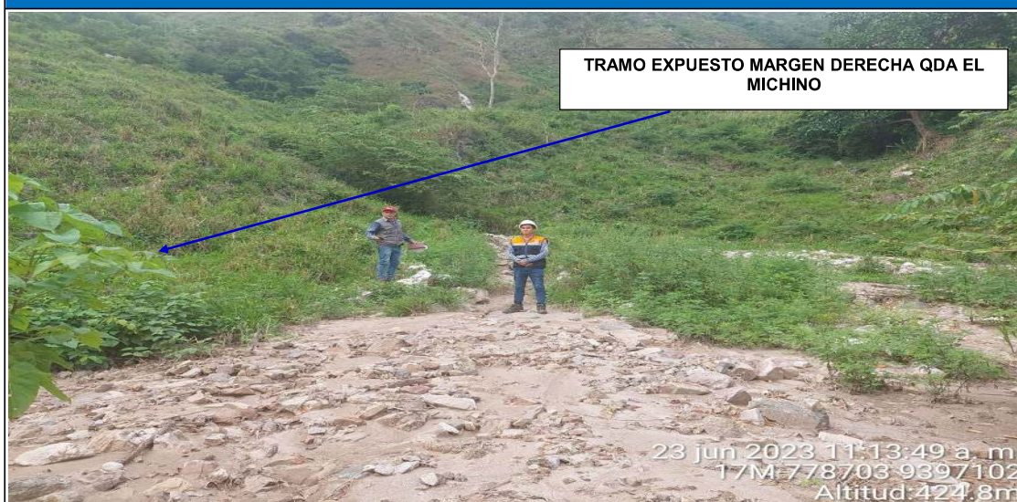
FIGURA N°01: TRAMO CRÍTICO A INTERVENIR QUE AFECTA ZONA AGRICOLA