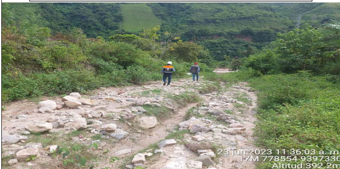
FIGURA N°02: MARGEN IZQUIERDA DE LA QDA EL MICHINO QUE AFECTA A CULTIVOS AGRICOLAS Y TAMBIEN SE OBSERVA REALIZAR LA LIMPIEZA Y DESCOMATACIÓN DEL CAUCE.

23 jun 2023 11:36:03 a. m. 17M 778554 9397330 Altitud:392.2m